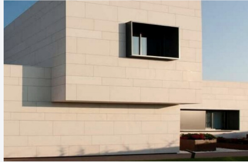
Cuarzo y arenisca