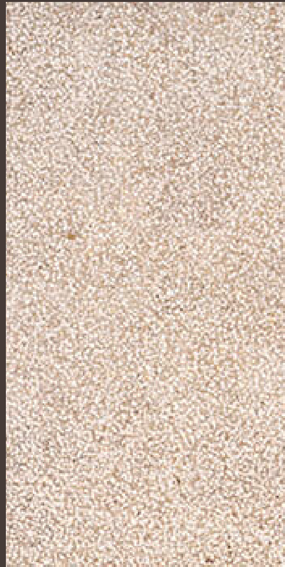
Envejecido y abujardado