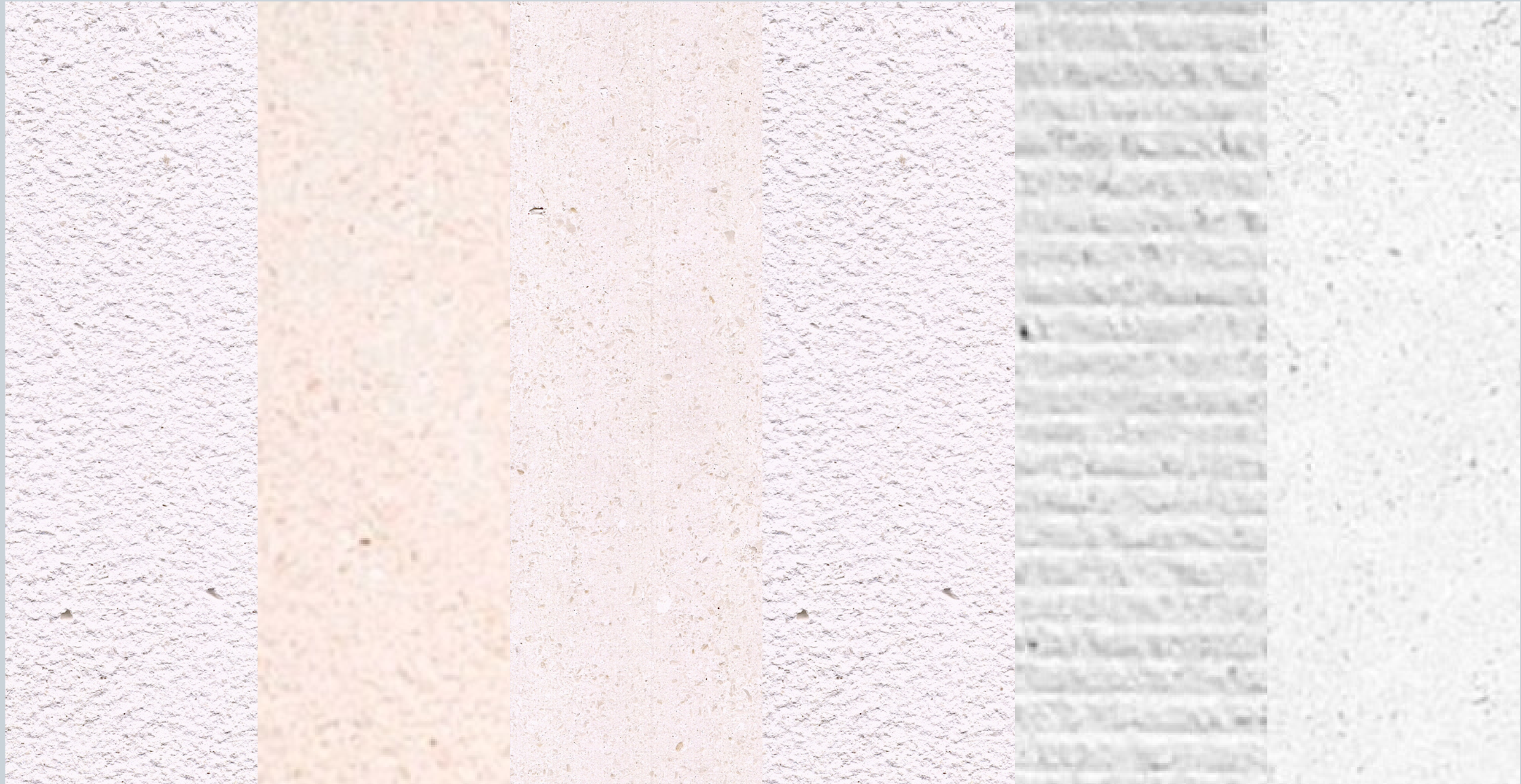
Abujardado y envajecido